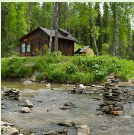
Музей истории, науки и техники Свердловской железной дороги