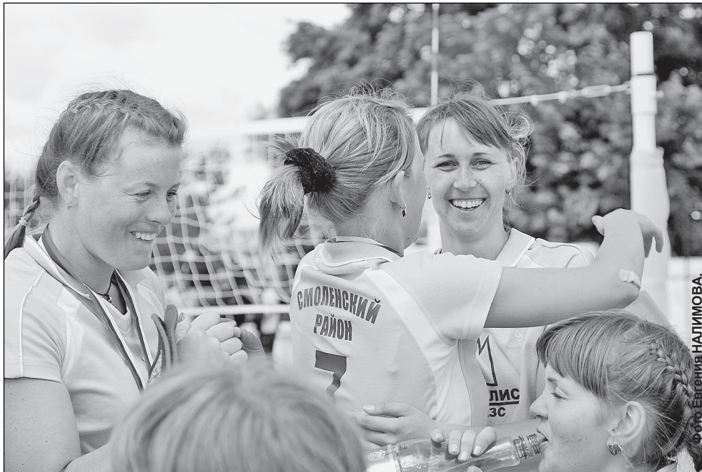
Теперь у сельских спортсменов больше возможностей участвовать в краевых соревнованиях.

5. Основанием для предоставления субсидии является соглашение о предоставлении субсидий, заключаемое между управлением и администрацией соответствующего городского округа, муниципального района.