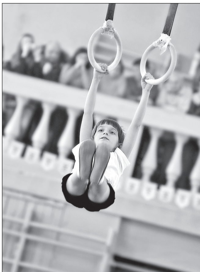
Всё только начинается.