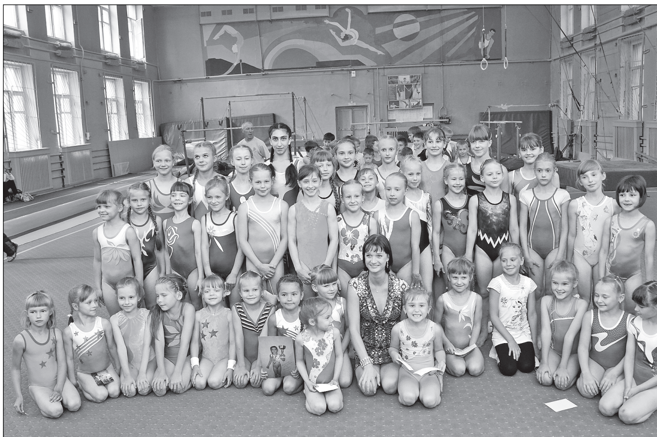
В гуще юных гимнасток звездная гостья Светлана Хоркина.