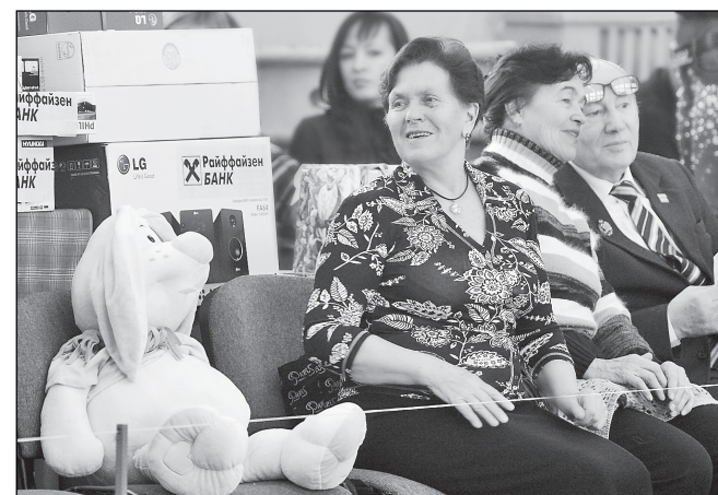
Старшее поколение спортивной гимнастики Алтая.

Ежегодно в декабре известнейших спортсменов в качестве почётных гостей собирает гимнастический турнир на призы Сергея Хорохордина. Большинство фотографий на этой странице, сделанных фотожурналистом Евгением НАЛИМОВЫМ, с этих соревнований.