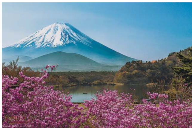
Гора Фудзияма – красивая и суровая.