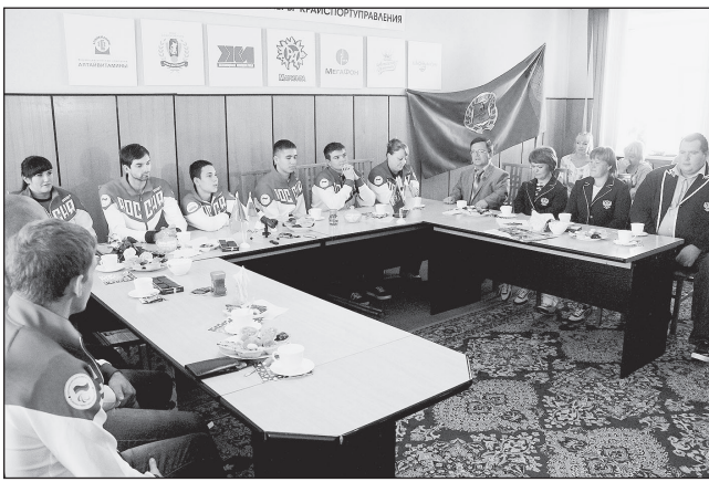
Паралимпийцы Алтая поговорили с краевым руководством спорта за чашкой чая.

дарного иранца Рахмана. Так что имелись все предпосылки к тому, что наши спортсмены будут с медалями.