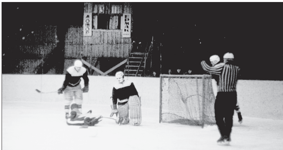
1967 год. Шайба в воротах «Ермака». Стадион «Мотор».

приходилось через знакомых, особо приближенных к хоккеистам, узнавать авторов заброшенных шайб на выезде, потому как они не всегда отмечались в краевых газетах. Конечно, такая информация не считается официальной, хотя, по сути, таковой и должна быть. Поэтому при отсутствии протоколов или отчетов в газетах такая статистика является авторской. У меня таких тетрадок за полвека накопилось множество, есть и выписки из командных журналов, когда статистику игроков вели сами тренеры. Есть и хроника событий, взятая из краевых газет. Есть «валовики» статистиков из других городов, которым я доверяю.