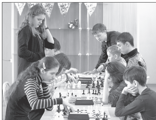
Учебный сбор завершился весёлым блицтурниром.