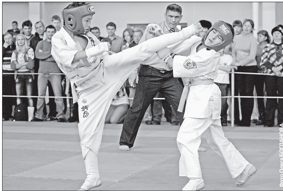
Без поражений нет побед.