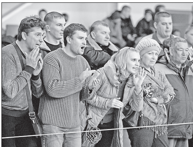
Папы и мамы помогли как могли.

лающие могут найти единоборство по своему вкусу. На «Золоте Алтая» было представлено 25 дисциплин: от ставших уже традиционными айкидо и тхэквондо до экзотических джиу-джитсу и капозйри. Соревнования собрали спортсменов различных возрастов и разного уровня мастерства.