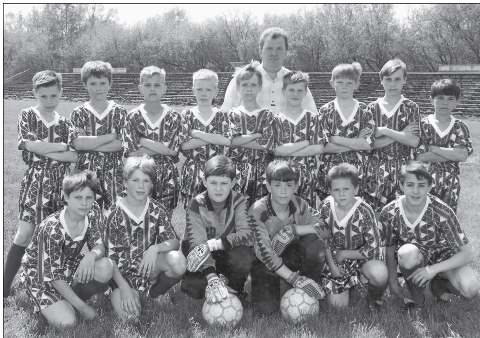
Одна из самых «звездных» юношеских команд «Динамо» – 1985-1986 годов рождения.

– То, что тупо поклоняемся Западу. Засилье иностранных