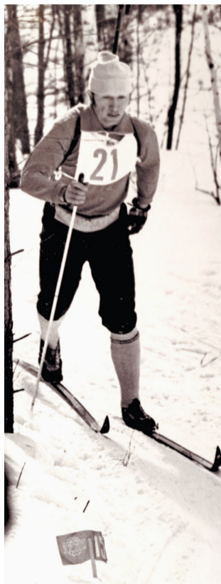
Чемпионат СССР. 1975 год. Спринтерская гонка.