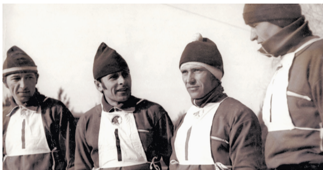
Красноярск. 1974 год. Спартакиада народов РСФСР. Квартет победителей.