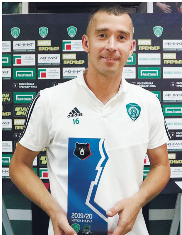
Очень приятно получить памятный приз лучшего игрока матча, тем более в игре против своей бывшей команды «Краснодар».

В «Ахмате» защитники тоже все как на подбор, вы-